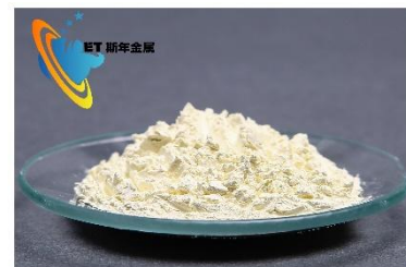
氧化铈 CAS NO.1036-38-3