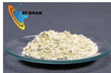
氧化钬 CAS NO.12055-62-8