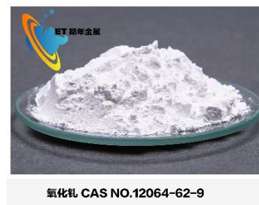
氧化钆 CAS NO.12064-62-9