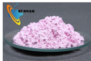
氧化铒 CAS NO.12061-16-4